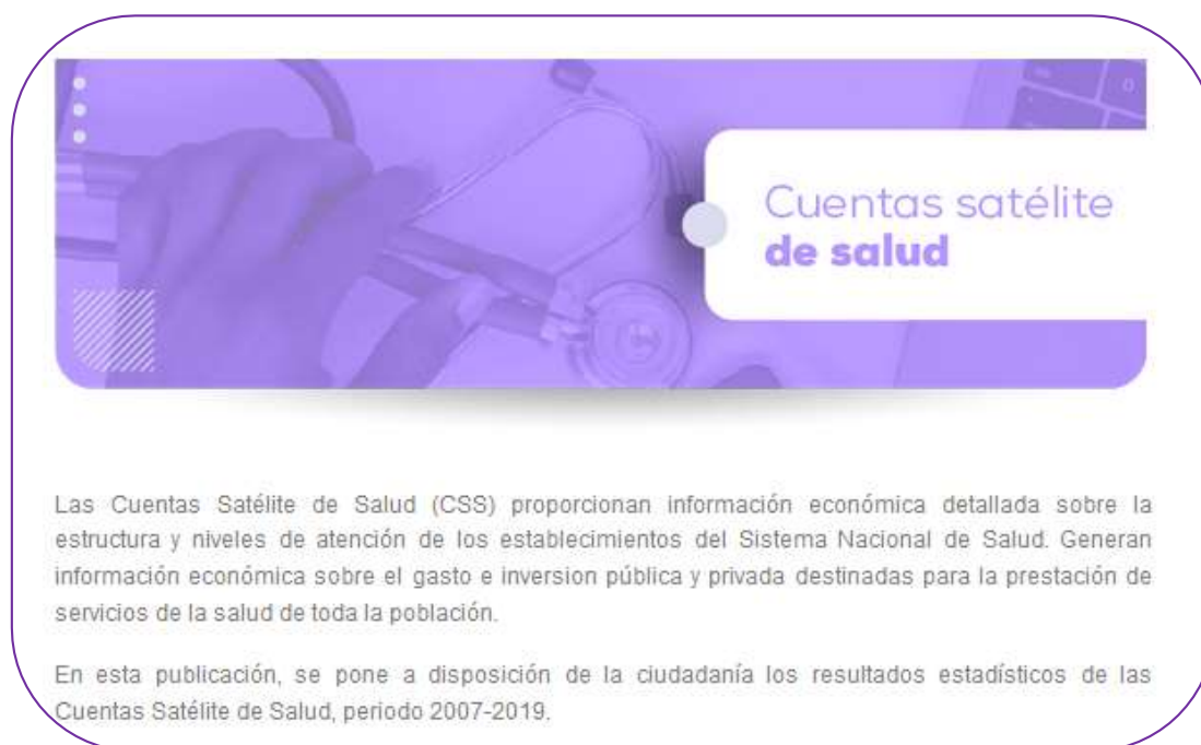
Gráfico 1. Encabezado y reseña de las CSS

El portal web institucional de las CSS es realizado por DICOS. En primer lugar, el portal presenta el encabezado de las Cuentas Satélite de Salud con su breve reseña: