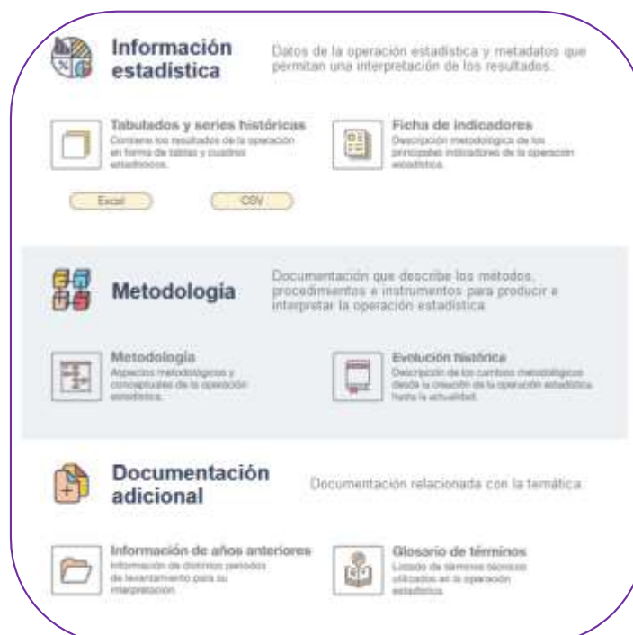
Gráfico 3. Información estadística, metodología y documentación de las CSS

Finalmente, se presenta la información estadística, metodología y documentación adicional. Todos estos puntos ya fueron descritos en la Tabla 1 en la cual se establece todos los productos finales a entregarse.